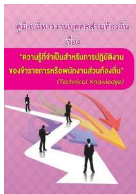
หนังสือ ความรู้ที่จำเป็นสำหรับการปฏิบัติงาน ของข้าราชการหรือพนักงานส่วนท้องถิ่น